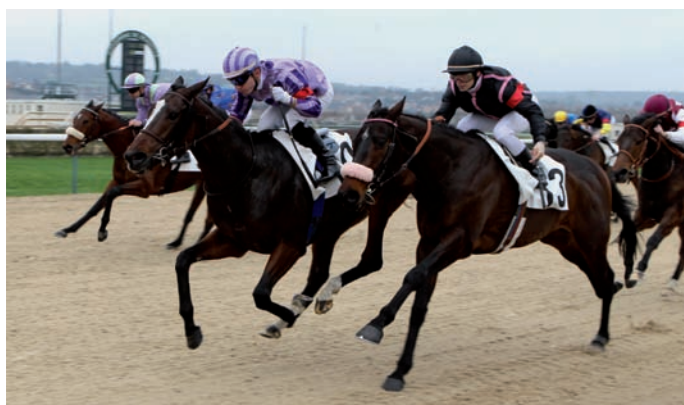
Le 4 janvier Walk on Velvet terminait second