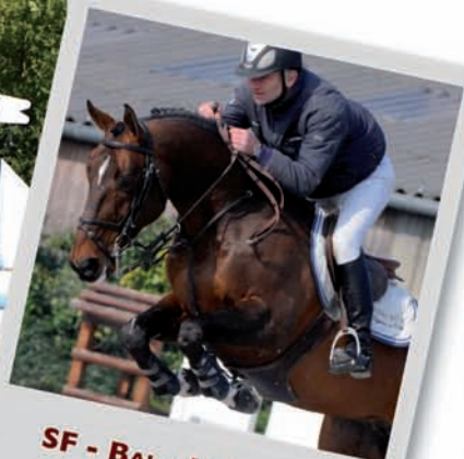
SF - BAI - 1M66 - 2001