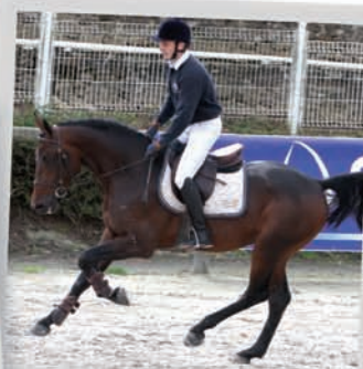
Niagara d'Elle x Cassini I