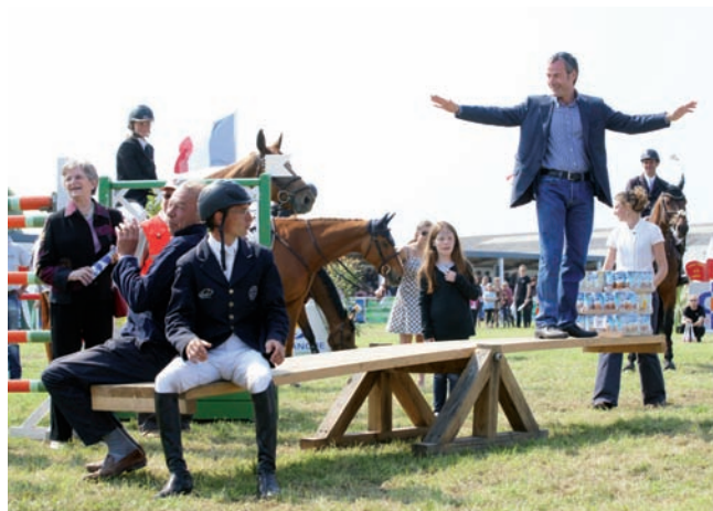
Meilleur cavalier à Sainte-Mère-Eglise en 2011

« Si le cheval n'est pas respectueux à quatre ans, il ne le sera pas à dix »