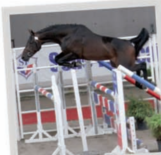
SF - BAI - 1M64 - 2008