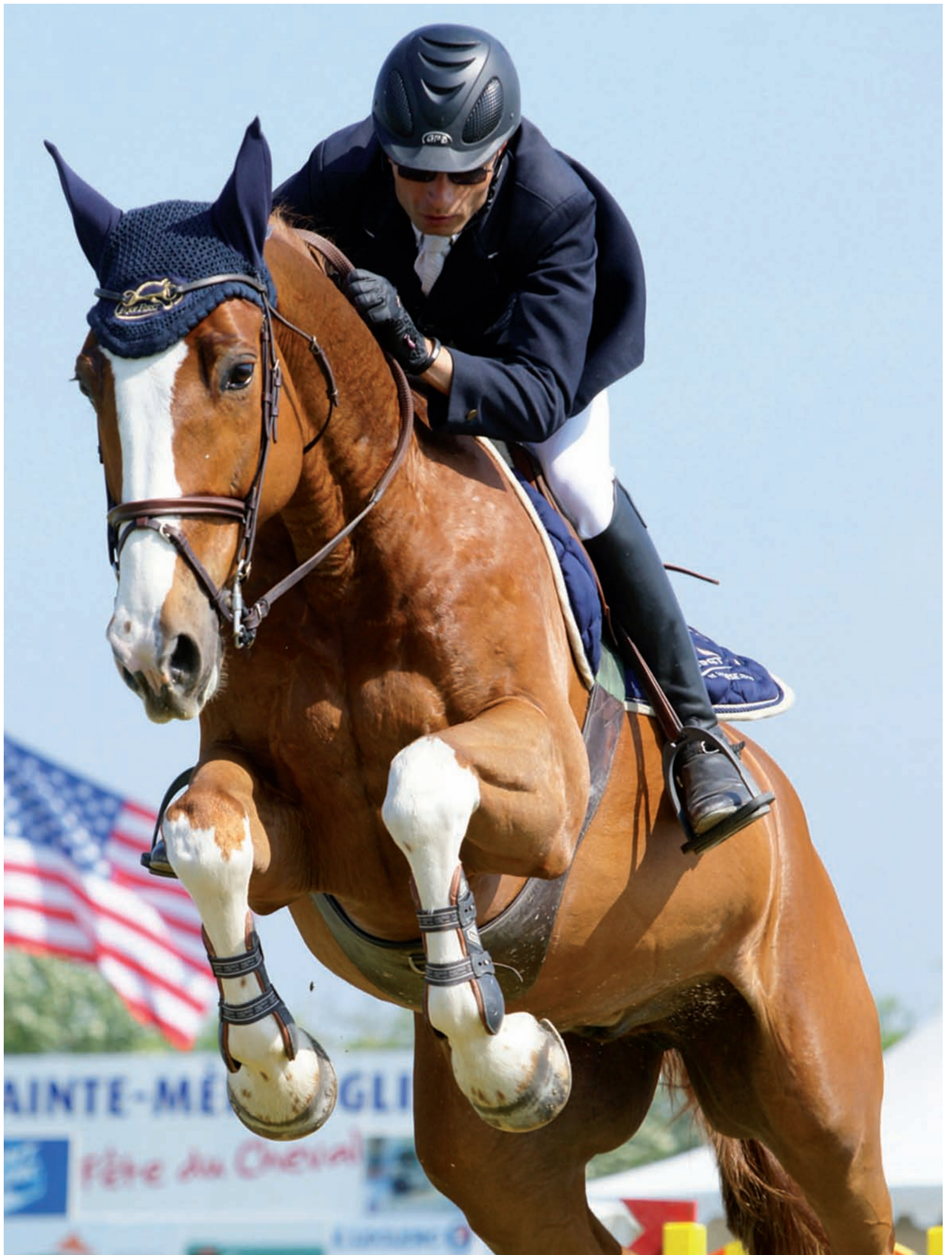
Premier de la Vallée