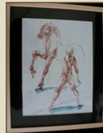
Prix Suprême Foal

• Intérêt des acteurs de la filière La qualité du travail de Christophe Rouil mise en avant selon 3 axes de communication / Acquisition d'œuvres d'art contemporain exposée au public / Sélection d'un peintre « VIP » et achat d'œuvres pour remise de prix / Exposition « live » et vente privée / ont ouvert des perspectives de collaboration pour 2013