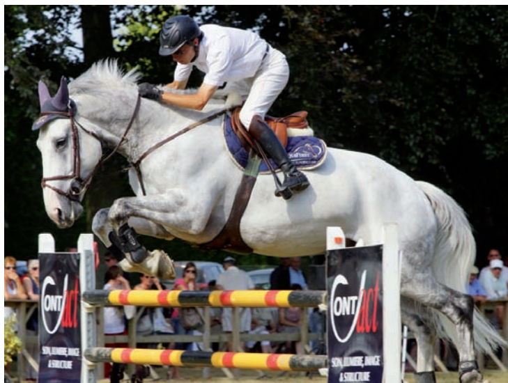
Quastor de la Vallée