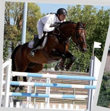
Quick Star x Jalisco B ORIGINE 100% SF