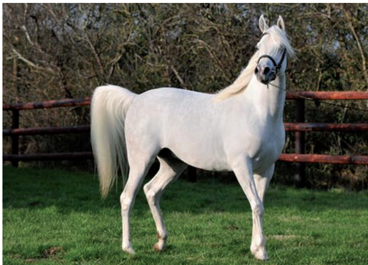
Shanghai EA, PS Arabe de show, vainqueur de la All Nations Cup à Aix la Chapelle en 2011, dans les paddocks du centre de congélation