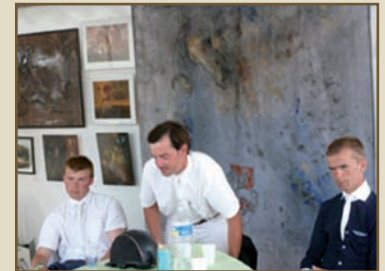
Les 3 vainqueurs du Grand Prix du Conseil Général prennent place pour la Conférence de Presse