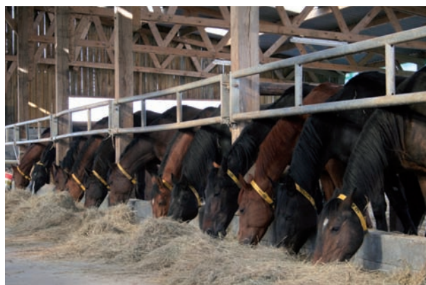
Les juments receveuses d'embryons sont mises sous lumière