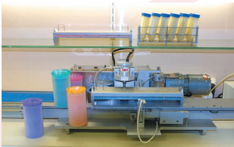
Mise en paillette de la semence à 4°C

Equitechnic pratique également le transfert d'embryons. Pour cela la société possède son propre troupeau de juments receveuses, des juments de sang pour la plupart trotteuses. Comme pour les étalons, cette technique de reproduction permet à une jument d'élite de mener sa carrière sportive et de reproductrice de front. De plus, la donneuse d'embryons ne prend pas le risque de pouliner car le poulinage reste en effet un moment à risque dans la vie d'une jument. Pour proposer le meilleur service, une fusion de l'équipe de congélation Equitechnic avec l'équipe de techniciens spécialisés en transfert d'embryons d'Amélis a permis une mise en commun des connaissances et des savoir-faire. Il s'agit là certainement de la fusion des deux meilleures équipes normandes. Cette synergie des compétences permet aux techniciens d'être parmi les plus performants. Il en ressort chaque année 350 gestations après transferts d'embryons dont 80 à 100 sur les juments receveuses suivies par Equitechnic.