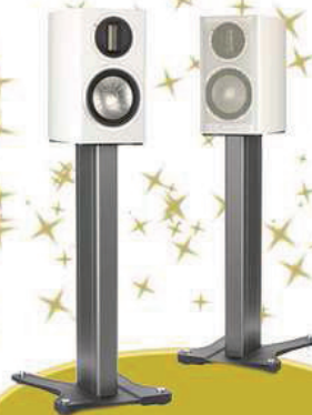
MONITOR AUDIO GX50