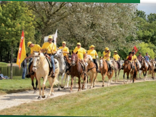
Photo : Equirando 2008