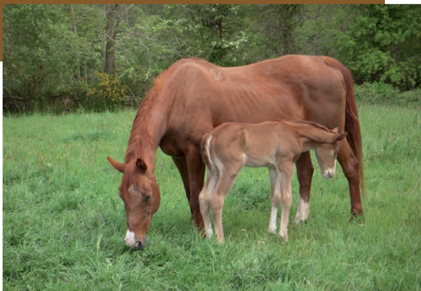
Vanille du Tertre

D'un tempérament très vif, le Lyonnais à une démarche sinon atypique du moins bien ciblée en matière de croisement. Il privilégie les chevaux très proches du sang et pratique des accouplements avec des pur-sang sachant qu'historiquement la naissance des cracks relève plutôt du sort de la nature.