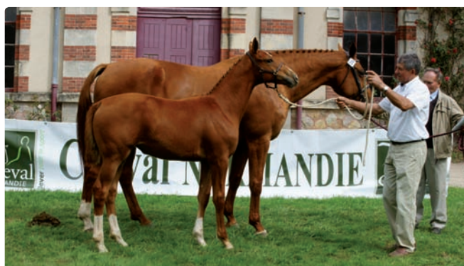
Classe femelles âgées : Belle de la Fosse (Igor des Fontenis et Si Tu Viens) à Marc Guillard de Subigny