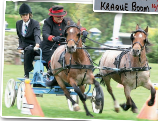
Mamie tu déchires grave !

TRIPLE A J'Y AIME FRAMENCO 14/1 QUICK STUDY 20/1 PROT BLUE 5/1 BILLY CONGO 12/1 MURKAS VINDICAT 14/1 KRAQUE BODM 16/1