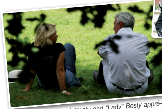
Habités d'Hickstead, Bosty and "Lady" Bosty apprécient les subtilités et la finesse du British way of life