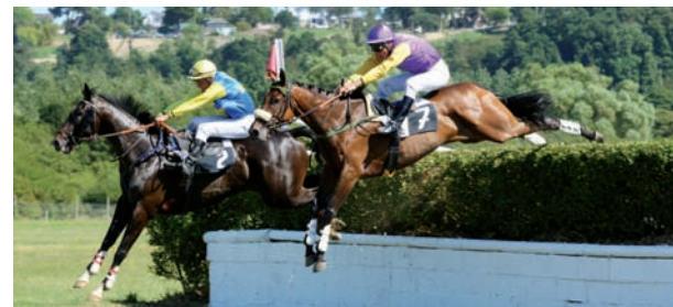
et Runaway River (2)