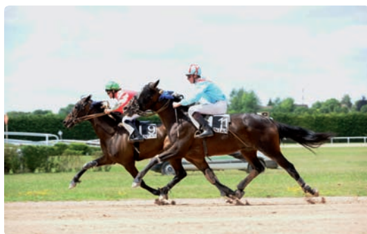
Arrivée du Prix Yearly