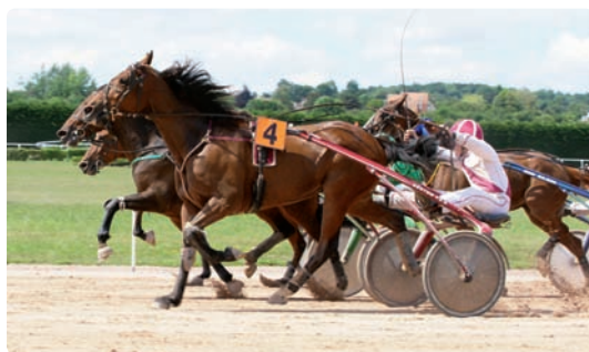
Arrivée du Prix Clean Box