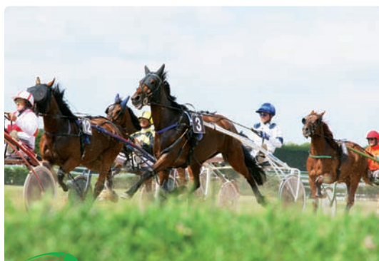
Arrivée du Prix Magasin Vert

C haque année, le groupe AGRIAL, convie ses partenaires et fournisseurs équins à une réunion de courses à leurs labels respectifs. Cette année, c'est sur l'hippodrome d'Argentan, noyé de soleil, qu'Agrial avait dressé son grand chapiteau.