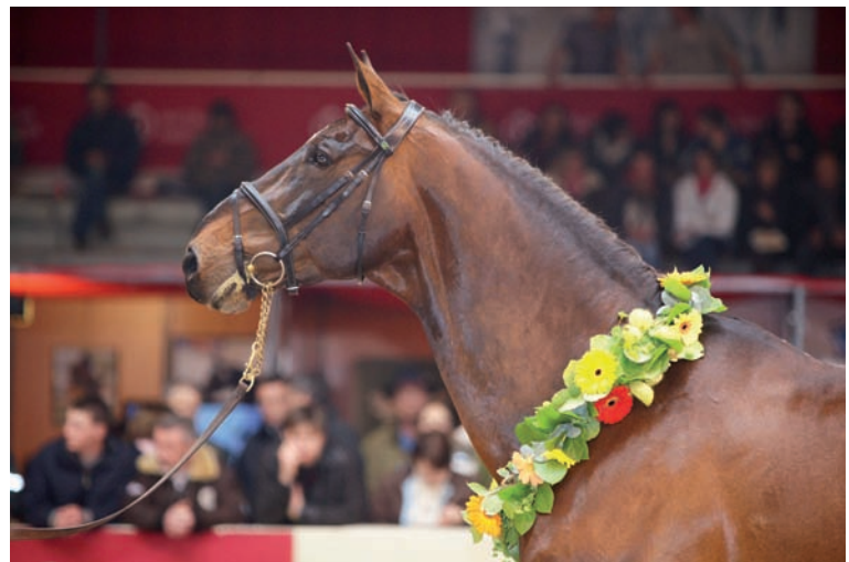
La cérémonie des 20 ans de Diamant de Semilly a marqué cette 6ème édition du « Stallion Masters » Saint-Lois.